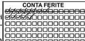
Questo Giocatore, dopo aver ricevuto 8 ferite, trova un Kit di Pronto Soccorso, ha barrato il primo Conta Ferite e ha ripreso dal secondo.