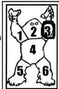
Il Punto Debole di questo Ghoul è il suo braccio sinistro, corrispondente all'area numero 3.